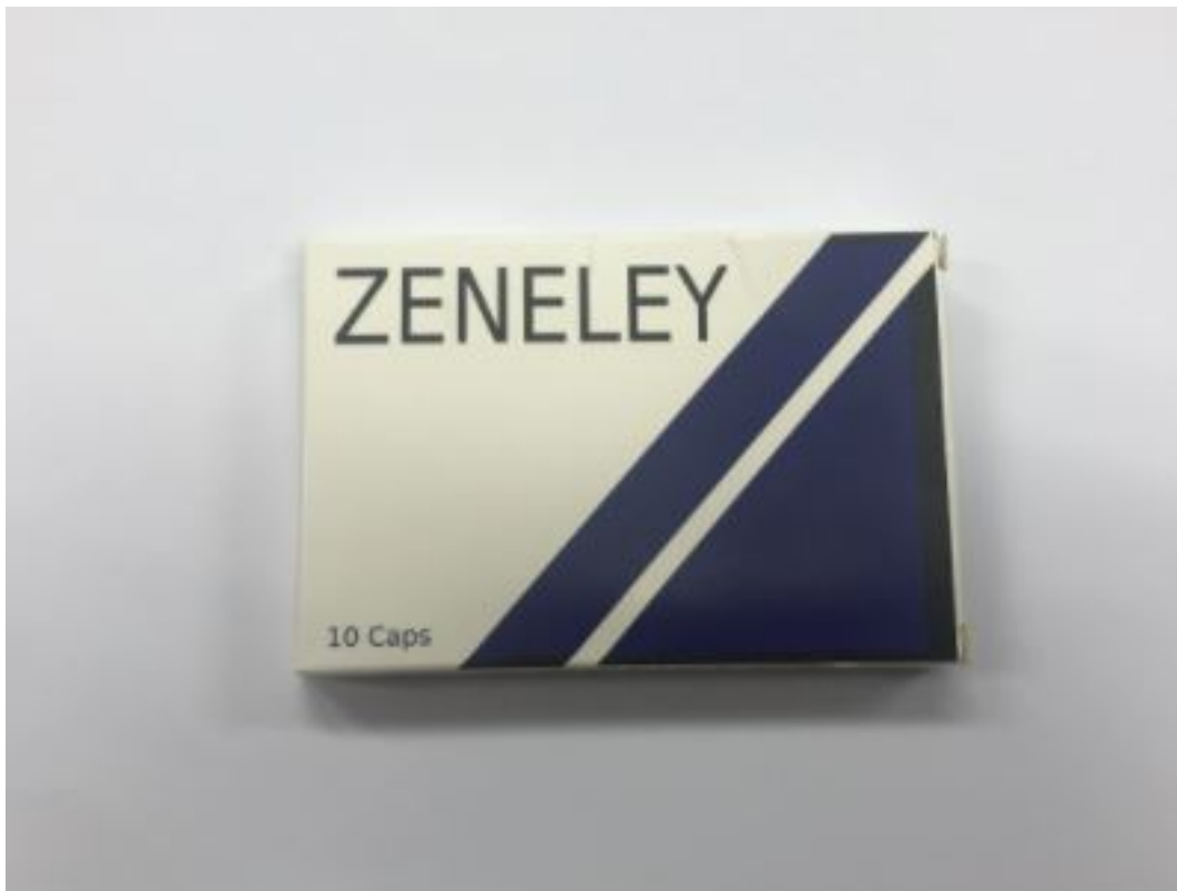
Fig.1: Imagen del producto ZENELEY cápsulas